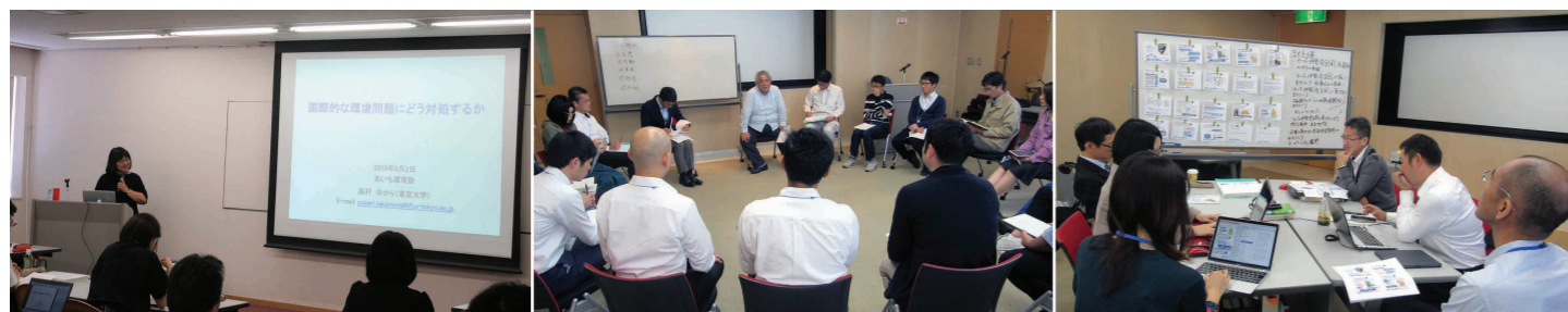
著名な講師による講義

卒塾生は、塾で学んだ環境に関する知識を生かし、職場改善や地域での環境活動に取り組んでいます。また、塾生同士、アドバイザー講師、卒塾生、講師とのネットワークが築かれるのも「塾」の目的であり、そのネットワークが卒塾後の活動に生かされています。卒塾生や地域社会を創る人たちの活動の場として、卒塾生等が中心となりNPO法人AKJ環境総合研究所を設立し、2014年度から活動しています。