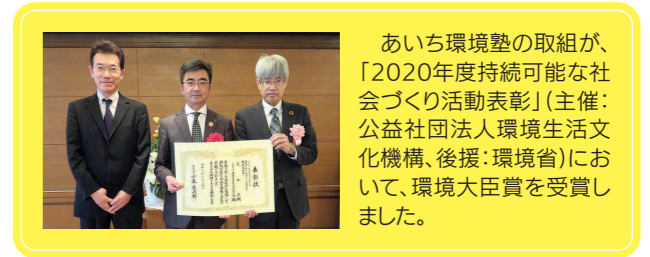
あいち環境塾の取組が、「2020年度持続可能な社会づくり活動表彰」(主催:公益社団法人環境生活文化機構、後援:環境省)において、環境大臣賞を受賞しました。